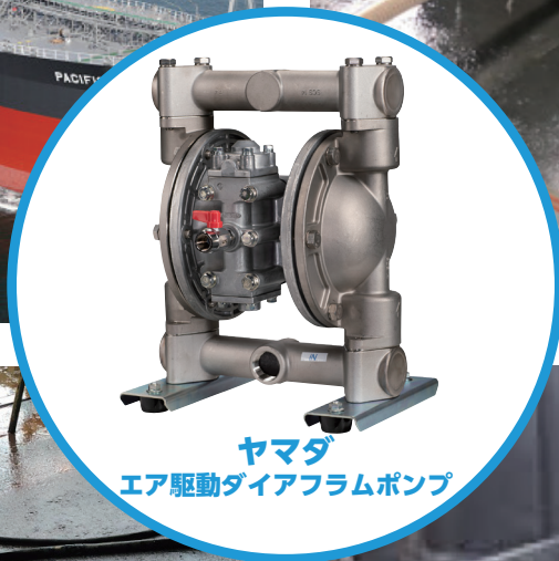
ヤマダ エア駆動ダイヤフラムポンプ