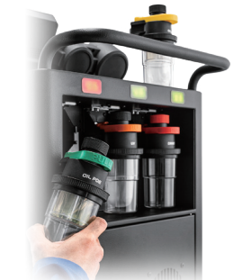
自動内部フラッシングシステム搭載